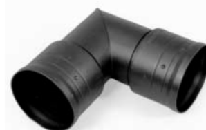
codo 45° ó 90°