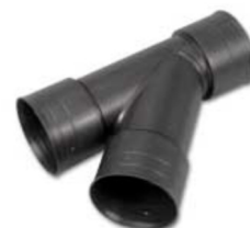
conector T 45°